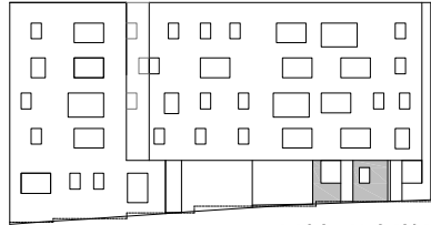
ALZADO CALLE PACHECO 7